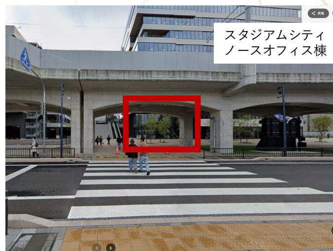
JR長崎本線高架側からの写真